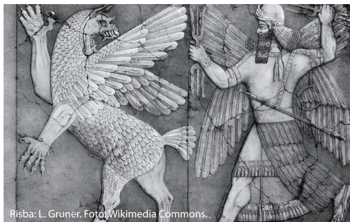
Risba: L. Gruner.